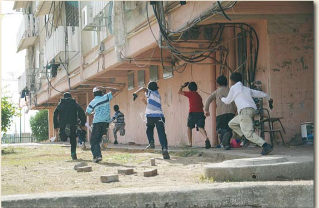
ילדים מקריית מלאכי רצים לתפוס מחסה מפני הרקטות ששוגרו מרצועת עזה

הסיפורים שהילדים שלי אוהבים מאוד לפני השנה, הוא הסיפור "מרק מכפתורים". הסיפור מתחיל בקבצן שהולך בדרך מושלגת, בחושך גמור ואינו מוצא עיירה שידע על קיומה. הוא מדמיין את הארוחה הנהדרת שיקבל בהגיעו אליה אך מסתבר לו כי איש מהעיירה לא מוכן לפתוח לו את הדלת. הסיבה לדלתות החסומות היא שכל אנשי העיירה הם עניים כמו הקבצן ואין להם דבר לתת לו. אפילו