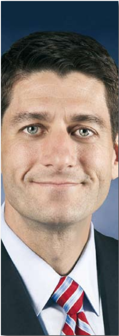
פול רייין. קורא איין ראנד לפני השניה

ארה"ב היא אחת המדינות שבהן הסיכוי להיחלץ מעוני הוא הנמוך ביותר בעולם המערבי. אחת הסיבות לכך היא המדיניות הכלכלית שמעניקה הטבות עצומות לאליטה הכלכלית. הטבות אלו הרחיבו את הפערים עד כדי כך, עד ש-400 האמריקאים העשירים ביותר מחזיקים בהון השווה בערכו להון שנמצא בבעלותו של החצי העני יותר מאוכלוסיית ארה"ב, 150 מיליון איש. מדיניות זו מתוחזקת ומקודמת על-ידי בעלי ההון, לוביסטים ופוליטיקאים הקשורים ביניהם בקשרי הון-שלטון עבותים. הנציג הבכיר ביותר של מדיניות זו הוא לא אחר ממי שהיה המועמד הרפובליקני לסגן הנשיאות, פול רייין, שהכריז בעבר כי הוא רואה כמופת לחיקוי את הסופרת איין ראנד, כוהנת השוק החופשי הפראי, מחברת הספר "מרד הנפילים". על כל זאת ועוד תוכלו לראות בסרט הזה, "פארק אווניו" שהופק במסגרת הפרויקט "למה עוני?" והוקרן לאחרונה בערוץ הראשון.