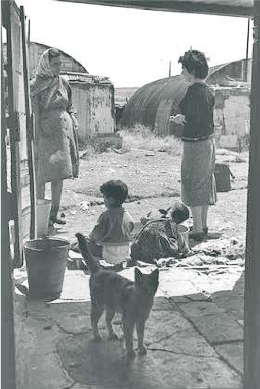
עובדת סוציאלית בביקור במעברת תלפיות, ירושלים, 1958

שובו של שיח השליחות והמעורבות למטה השיתופי, נובע מתוך שאלה רחבה יותר: האם הקיבוץ הוא מטרה לעצמה, או אמצעי לתכליות אחרות? מהו יותר: בית או דרך? הבידור הזה חשוב משום שבכמה מקרים בעבר, מעורבות הקיבוץ בחברה הישראלית הזיקה לו יותר משהועילה