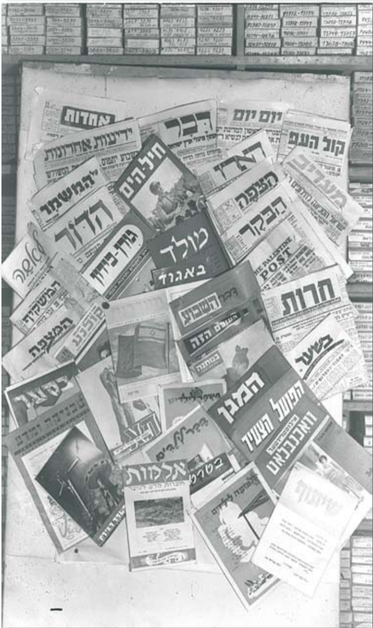
עיתוני ישראל 1949

מה שנחוצו לשיתופיים הוא עמדה לא מתנצלת, ויכוח בין שותפים לדרך שיכול להעלות שאלות קשות יותר מצד אחד ולוותר על תעמולה והילול עצמי מצד שני. דווקא עיתון פנימי שפונה לציבור מוגדר יכול לנהל דיון נוקב יותר שעומד על סדר היום של תנועת הקיבוצים השיתופיים