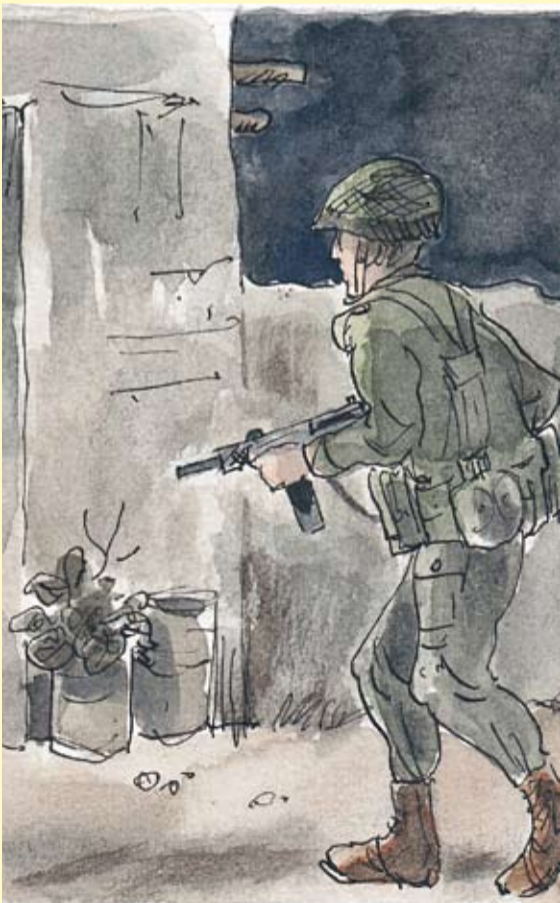
איור: יעקב גוטרמן

הסיפור השני: לפני 40 שנה הייתי מפקד פלוגת מילואים ששרתה בחאן-יונס ברפיה. תפקידנו היה ללכוד מחבלים ולישמור על הסדר (לכידת המחבלים היתה בעזרת השב"כ). הב"תים במחנה הפליטים בחאן-יונס היו בנויים כך: חצר שמחוב"רת לבית ובתוך החצר היו תרנגולות, תנור (טבון) ועוד. שער החצר היה נעול. אם נכנסת לחצר, אתה כבר בתוך הבית. חיילי הקיפו בית כזה. לקחתי איתי חייל (ד"ר לכימיה) שסימכתי עליו. לקחנו סולם, קפצנו אל החצר, רצנו לתוך הבית ומצאנו את המחבל במיטה לוקח את אקדחו שהחזיק ליד מיטתו. אני הייתי עם עוזי דרוך ואצבע על ההדק. יכולתי להרוג אותו, אך במקום זאת בעטתי ברגלי והעפתי את האקדח מידו. אוקתי אותו חי באזיקים. אני זוכר עד היום את המקרה הזה, שקרה לפני ארבעים שנה (עברתי מאז עוד חוויות מלחמתיות). ואני שואל את עצמי, מה עבר לי בראש בעשירית השנייה הזאת שגרם לי לא להרוג אותו אלא לאזוק אותו חי.