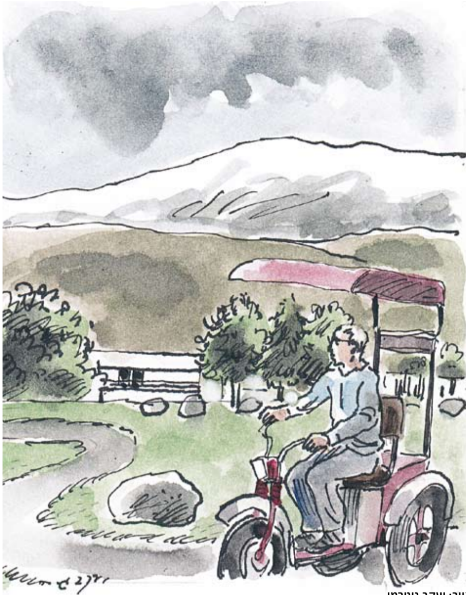
איור: יעקב גוטמן

גלעד: "ההחלטות מצוינות. הן קובעות שלחבר ולחברה יש זכות לפנסיה והן מוסיפות וקובעות גם איך מחשבים את הקצבה. הן אומרות שהמקור של הקצבה הוא כל מה שיש בקיבוץ, ולא מגבילות את המקור לנכסים מסוימים והן קובעות קדימות