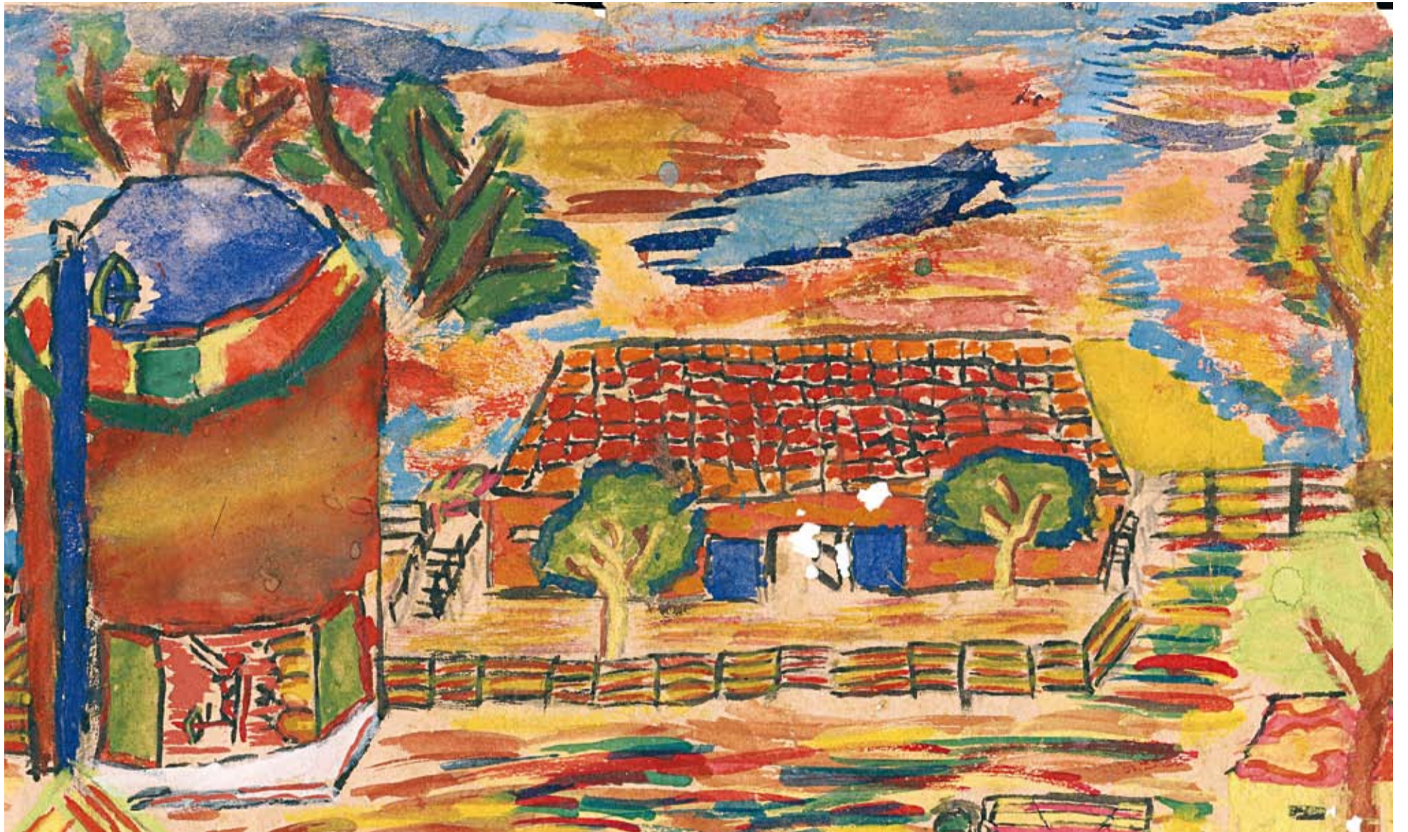
רוח גן שמואל. ציור החצר הגדולה שצויר על ידי אחד מילדי קבוצת "רעים", מראשוני הילדים בגן שמואל